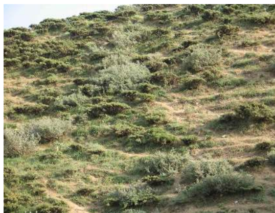
شکل ۴: نمایی از حضور (سمت چپ) و عدم حضور (سمت راست) گونه F. armena در منطقه

روش سطح حداقل، ۱/۷۵ متر مربع تعیین شد و با توجه به فرم رویشی گونه‌های غالب و الگوی پراکنش گونه‌ها شکل پلات، مستطیلی در نظر گرفته شد. در هر پلات، درصد پوشش گیاهی کل، درصد پوشش، حضور و عدم‌حضور و تراکم گونه F. armena ، لاشبرگ، سنگ و سنگ‌ریزه و خاک لخت محاسبه گردید. تولید هر یک از گونه‌ها به ویژه گونه F. armena به‌طور جداگانه از سطح زمین با قیچی