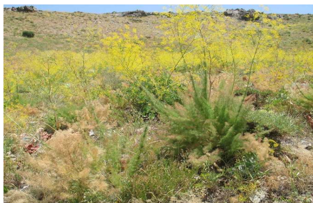
شکل ۲: گونه مورد مطالعه ( Ferulago armena )

مختلف متغیر است. نتایج به دست آمده از پیمایش و بازدید میدانی و شناسایی گیاهان نشان داد که در منطقه مورد مطالعه تعداد ۲۹ خانواده، ۱۵۳ جنس و ۲۶۶ گونه وجود دارد. خانواده‌های Asteraceae، Poaceae، و Apiaceae دارای بیشترین تعداد گونه بودند.