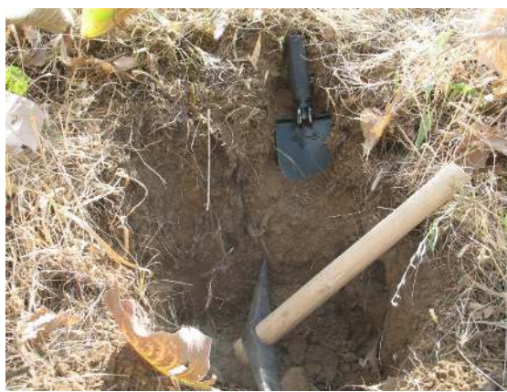
شکل ۵: نمونه برداری و خشک کردن خاک